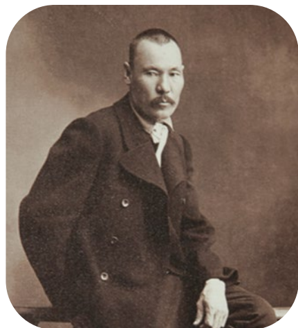
Г. И. ЧОРОС-ГУРКИН (1870—1937)

Григорий Иванович Гуркин родился в небольшом селе Улала (ныне — город Горно-Алтайск) Бийского уезда.