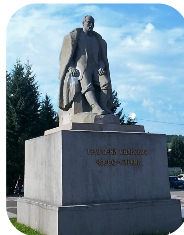
БЛАГОДАРНАЯ ПАМЯТЬ ПОТОМКОВ

Г. И. Чорос-Гуркин известен как первый профессиональный художник среди коренных народов Сибири. Его судьба и деятельность являются ярким примером служения своей малой родине и ее народу.